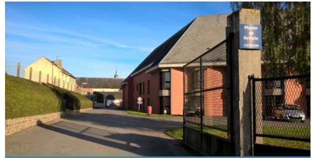
Centres hospitaliers, établissements de santé privés, maisons de santé ou de réadaptation fonctionnelle, établissements d'accueil de personnes âgées, d'adultes handicapés ou atteints de pathologie grave

À proximité de ces lieux : mesures de protection adaptées à mettre en œuvre (haies, matériels de pulvérisation, dates et horaires permettant d'éviter la présence de personnes vulnérables) ou distances d'interdictions fixées par arrêté préfectoral. ***