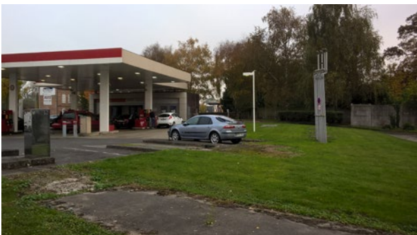
Établissements privés professionnels