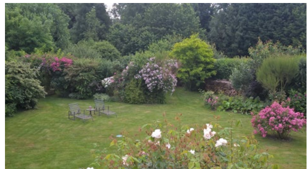
Espaces privés non professionnels (jardins, voirie et parcs)

Hors accueil de public (espaces et voirie) : tous produits homologués bénéficiant d'une autorisation de mise sur le marché.