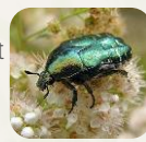
Cétoine dorée.

[cltic-info] blog « Sauvages du Poitou »