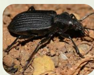
Carabe sp.

Ex : Cicindèles , staphylin , carabes , bousiers , etc.