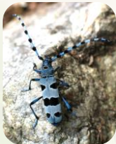
Rosalie des Alpes

Ex : Grand capricorne , Rosalie des Alpes , petite biche , etc.