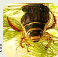
Dytique magné.