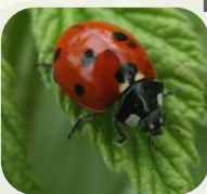
Coccinelle à 7 points.

Ex : Hanneton commun , charançons , chrysomèles , coccinelles , etc.