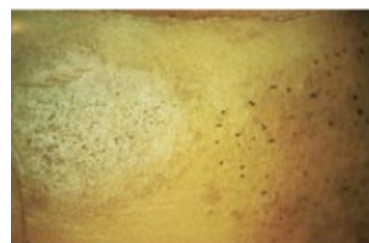
Gale argentée Dartoise