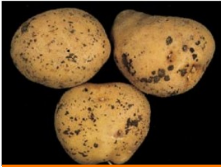
Sclérotés sur tubercules