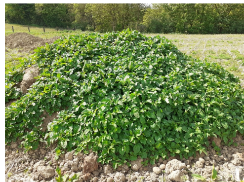
Repousses sur un tas constitué de déchets et d'écarts de triage (photo d'archive)