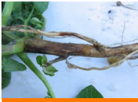
Attaque de rhizoctone brun sur tige