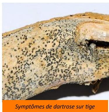
Symptômes de dartoise sur tige