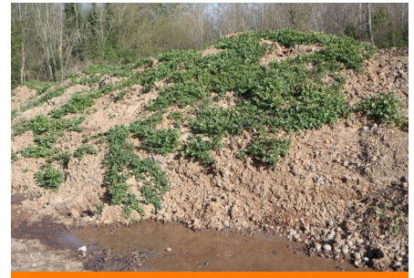
Écoulement de jus sur un tas non géré

N'épandez pas les déchets sur les parcelles cultivées et jachères après le mois de février car la destruction des tubercules par le gel est plus difficile.