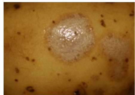
Gale argentée sur tubercule