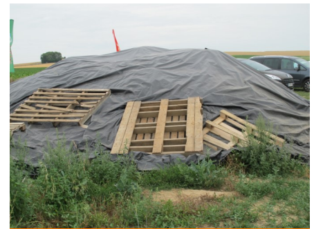
Tas de déchets bâché (photo d'archive)