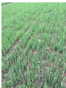
Figure 4 : Parcelle en lin fibre d'hiver au stade 18 cm