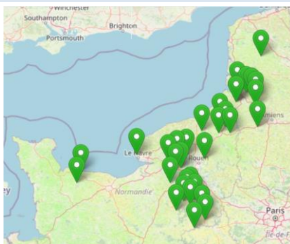
Figure 2 : Carte du réseau de parcelles