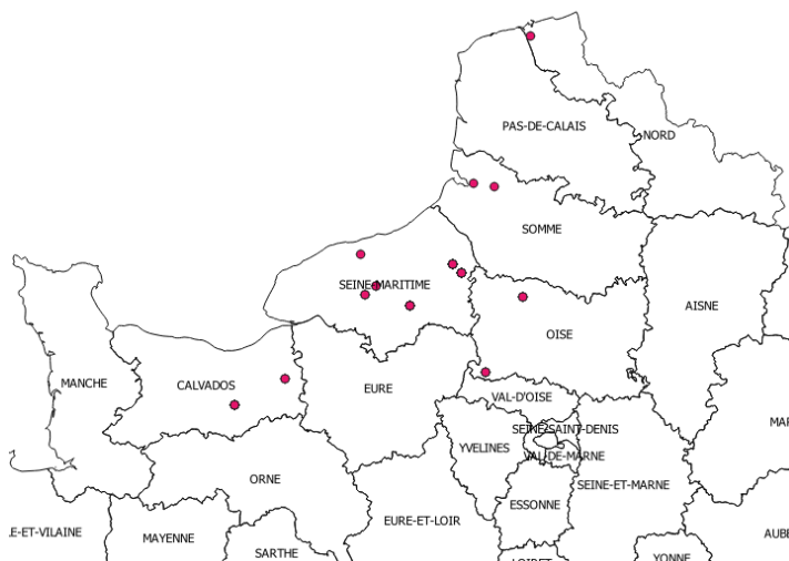
Figure 1 : Carte du réseau de parcelles

Action du plan Écophyto pilotée par les Ministères en charge de l'agriculture, de l'écologie, de la santé et de la recherche avec l'appui technique et financier de l'Office Français de la Biodiversité