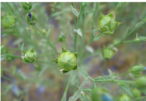
Oïdium généralisé sur lin (C. TORRECILAS – Institut du Végétal)

Malgré tout, hormis sur ces derniers semis, le stade de sensibilité à l'oïdium est dépassé.