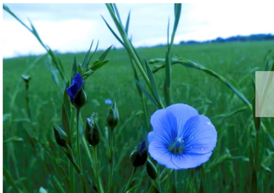
Premières fleurs de lin