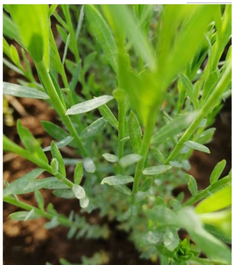
Oïdium sur lin