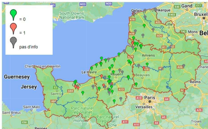
Cartographie des parcelles avec Oïdium (point rouge)

A ce jour on constate essentiellement des détections sous forme d'étoiles, il ne s'agit pas d'oïdium généralisé sur tige à ce stade (Hormis deux parcelles au stade floraison dans la Somme et une autre au stade D4 dans le Calvados).