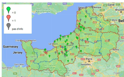
Réseau d'observation cette semaine