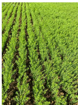
Lin à 15 cm

Dans beaucoup de situations, l'eau n'est pas le facteur limitant à la croissance des lins, ce serait plus les températures. Les lins ont malgré tout pu profiter de températures favorables fin de semaine dernière pour accélérer leur croissance. Ci où là, des épisodes orageux sont survenus.