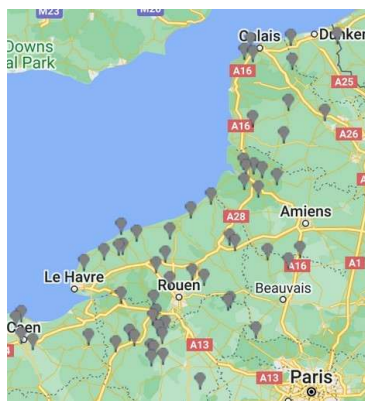
Réseau d'observation cette semaine

Cette semaine, le réseau est constitué de 37 parcelles :