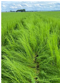
Zone de parcelle versée (H. GEORGES CA 80)

Les conditions de températures plutôt fraîches et l'humidité des sols font que la croissance des lins est régulière mais malgré tout modérée en général. Beaucoup de parcelles approchent du stade floraison. Des premiers cas de verse sont signalés. Quelques cas de grêle sont aussi notés.