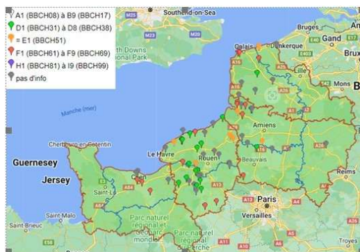
Réseau d'observation cette semaine