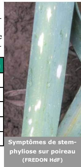
Symptômes de stemphyliose sur poireau (FREDON HdF)