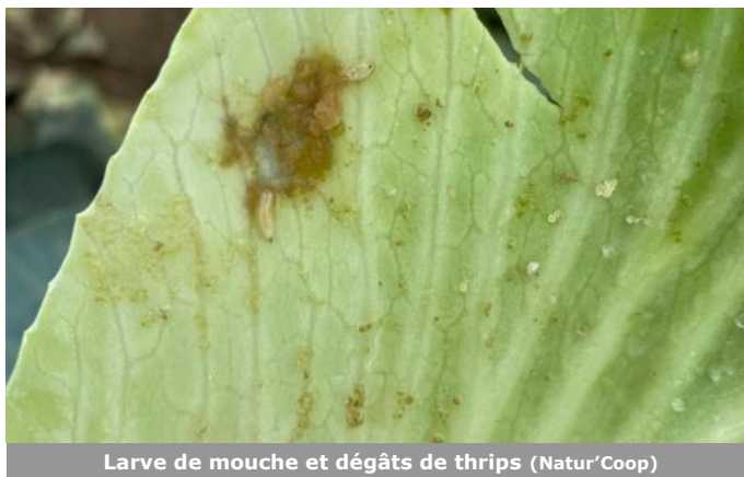
Larve de mouche et dégâts de thrips (Natur'Coop)

Attention de bien stocker des choux sains pour éviter la proliférations des attaques surtout en stockage précaire.