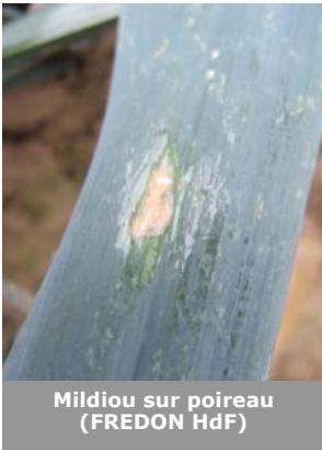
Mildiou sur poireau (FREDON HdF)

Des températures comprises entre 12 et 34°C, et une humidité élevée sont favorables au développement de cette maladie.