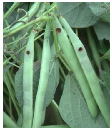
Les chenilles d'héliothis et de pyrale sont des foreuses : elles creusent des galeries dans les gousses de haricot et de flageolet (UNILET)