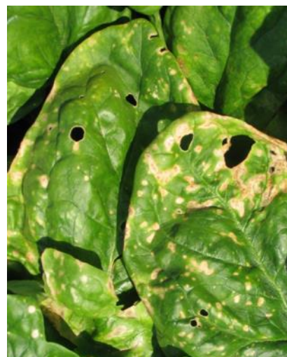
Anthracnose sur épinard : taches brun clair plus ou moins circulaires qui évoluent en nécroses

Les protections des cultures ont fait reculer le mildiou apparu ces dernières semaines. Quelques symptômes d'anthracnose sont maintenant signalés.