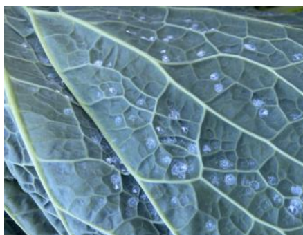
Aleurodes sur chou frisé

Les aleurodes se cachent parfois sur la face inférieure des feuilles. Ce sont surtout les dégâts indirects qui sont préjudiciables pour la culture : la fumagine (maladie provoquée par des moisissures noires dues à des champignons) se développe grâce au miellat sécrété par les insectes piqueurs-suceurs. Attention à ne pas se laisser envahir car ces insectes se multiplient très rapidement. Les conditions météorologiques actuelles (diminution des températures, pluie) limitent leur multiplication. Surveillez vos parcelles !