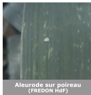
Aleurode sur poireau

De la rouille est constatée sur 4 des 5 parcelles évaluées. Dans le secteur des Flandres (59), la rouille commence à apparaître. Des températures comprises entre 10 et 24°C ainsi que des conditions humides sont favorables à son développement. Soyez vigilants en particulier sur les variétés sensibles. Les feuilles de la base sont généralement les premières à être touchées par la rouille, car ce sont les plus âgées. La maladie progresse ensuite vers les étages supérieurs. En cas d'attaque importante de rouille, la rentabilité de la production est affectée car des frais supplémentaires sont à prévoir pour éplucher les poireaux endommagés.