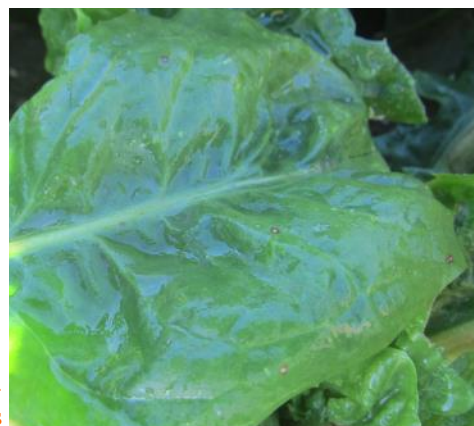
Alternariose sur endive (FREDON HdF)