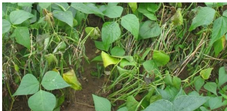
Sclérotinia sur haricot : pourritures sur gousses, dessèchement des tiges, formation de sclérotés blancs puis noirs (UNILET)

Des dégâts de chenilles foreuses sont à nouveau signalés cette semaine sur la côte d'Opale (62) et dans l'Aisne (02). Ils se traduisent par des gousses percées et ont conduit à l'abandon de quelques parcelles.