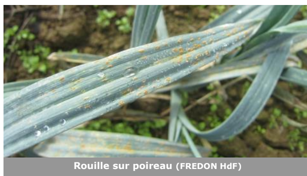
Rouille sur poireau