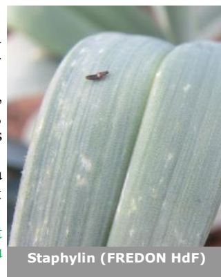
Staphylin (FREDON HdF)

De manière générale, le nombre de thrips diminue. Les températures comprises entre 6 et 18°C ainsi que les précipitations prévues la semaine prochaine seront défavorables au développement de ces insectes. Restez vigilants, surveillez régulièrement vos parcelles.