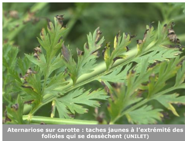
Alternariose sur carotte : taches jaunes à l'extrémité des folioles qui se dessèchent (UNILET)

Des pucerons lanigères ou pucerons des racines sont observés ponctuellement, sur le collet et sur les feuilles dans quelques parcelles de carotte. L'impact de ces insectes est très limité dès lors que la croissance des racines est assez avancée.