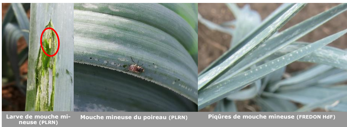
Larve de mouche mineuse (PLRN)

A Herlin-le-Sec (62), des dégâts de mouches du poireau sont constatés sur 8% des plants. A Violaines (62), ces dégâts sont relevés sur 36% des poireaux. Les conditions humides et les températures autour de 15°C lui sont favorables. Soyez très vigilants et allez observer régulièrement vos cultures d'alliacées (poireaux, ciboulette, ail, ...) pour détecter les premières piqûres. Si ce n'est pas encore fait (et lorsque c'est possible), couvrez vos cultures d'alliacées avec un filet anti-insecte. La protection de la culture doit être la plus précoce possible. D'autres méthodes de lutte physique semblent efficaces (ex: coupe au-dessus du fût pour les poireaux à l'automne, désherbage thermique pour les oignons au printemps). Ces techniques doivent être positionnées au bon moment, c'est-à-dire avant la descente de la larve dans le fût ou dans le bulbe (environ une semaine après la détection des premières piqûres), ce qui est compliqué à gérer.