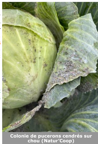
Colonie de pucerons cendrés sur chou (Natur'Coop)

Aucun signalement n'a été effectué cette semaine. Les conditions météorologiques douces et humides sont favorables à son développement. Le risque est surtout lié à la parcelle. Evitez les cultures sensibles et allongez les rotations avec des cultures non hôtes (céréales).