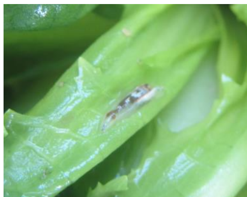
Larve de syrphe (FREDON HdF)