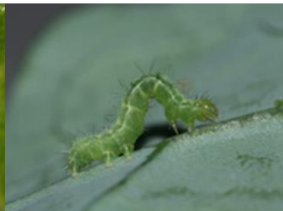
Chenille de noctuelle Autographa gamma (UNILET)