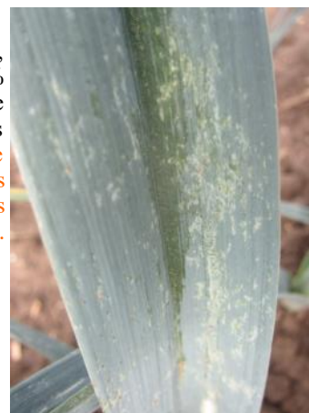
Dégâts de thrips sur poireau (FREDON HdF)

A Violaines (62), l'intégralité des poireaux est touchée par les piqûres de thrips, couvrant 40 à 80% de la surface des pieds. Entre 1 et 4 thrips sont présents sur 16% des poireaux. A Caëstre (59) et Wormhout (59), l'ensemble des pieds sont porteurs de dégâts et d'individus. Des auxiliaires ( Aeolothrips ) sont également signalés à Gentelles (80) et Amiens (80). De manière générale, il y a beaucoup de thrips adultes cette semaine, la pression est assez stationnaire mais évolue différemment selon les parcelles. Les températures comprises entre 8 et 19°C ainsi que les précipitations prévues dans les prochains jours seront défavorables au développement de ces insectes. Restez vigilants, surveillez régulièrement vos parcelles.