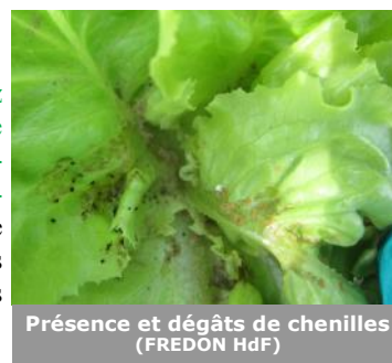
Présence et dégâts de chenilles

A Haubourdin (59), des aleurodes sont présents sur 24% des pieds. Normalement, ce ravageur ne pose pas de problème sur salades.