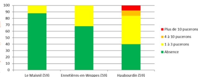
Pourcentage de salades avec la présence de pucerons aptères

Quelques auxiliaires sont aussi observés (punaise Orius, ...).