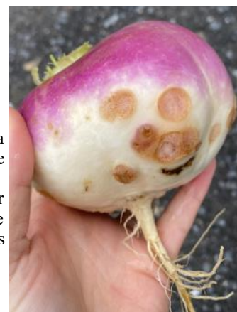
Gale sur navet (Natur'coop)