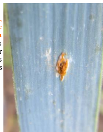
Tache de rouille sur poireau

Quelques parcelles commencent à présenter des taches de rouille. A Violaines (62), 8% des poireaux sont touchés par quelques taches. Les températures comprises entre 8 et 19°C et les averses prévues pour ces prochains jours risquent d'être favorables à son développement. Soyez vigilants en particulier sur les variétés sensibles. Les feuilles de la base sont généralement les premières à être touchées par la rouille, car ce sont les plus âgées. La maladie progresse ensuite vers les étages supérieurs. En cas d'attaque importante de rouille, la rentabilité de la production est affectée car des frais supplémentaires sont à prévoir pour éplucher les poireaux endommagés.