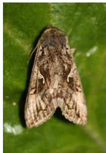
Papillon de noctuelle Autographa gamma (UNILET)

Situation saine, pas de signalement de maladie pour le moment.