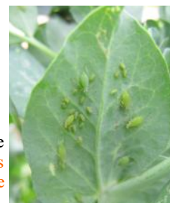
Pucerons verts sur pois (UNILET)

Aucune plante virosée n'a été signalée à ce jour et une faune auxiliaire active est présente.