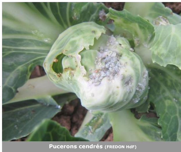
Pucerons cendrés (FREDON HdF)

A Illies (59), des dégâts de gibier sont constatés. Voir la partie salades concernant les mesures prophylactiques.