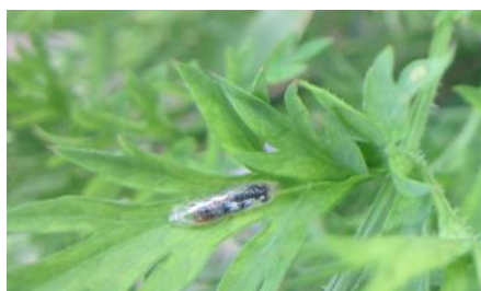
Larve de syrphe (FREDON HdF)

Les pucerons sont toujours présents sur carottes même si la pression est plutôt en baisse. Restez vigilants. Le seuil indicatif de risque est d'une plante colonisée sur deux.