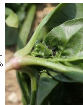
Pucerons noirs sur jeunes plantes d'épinard (UNILET)

Pas de symptômes de maladie observés dans le réseau.