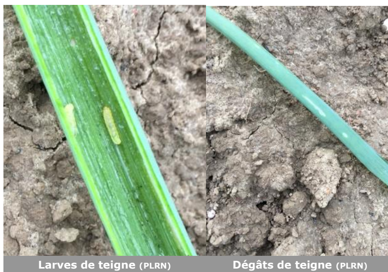
Larves de teigne (PLRN)

A Zuytpeene (59), sur oignons de semis et oignons bulbilles, 10 à 30% des oignons sont touchés par des dégâts de teigne, des larves sont aussi présents. Le risque est faible, même en cas de forte infestation, il ne semble pas y avoir d'impact sur le rendement.