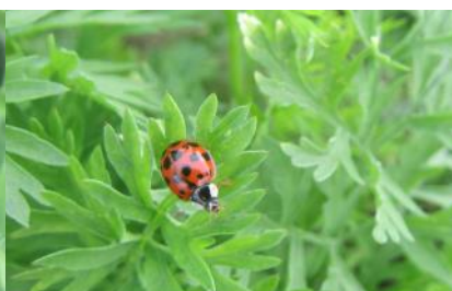
Coccinelles (FREDON HdF)