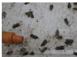
Tordeuse sur plaque engluée (UNILET)