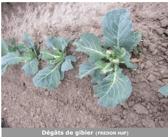
Dégâts de gibier

A Ennetières-en-Weppes (59), aucune ponte n'a été observée sur les feutrine. A Gentelles (80), aucune mouche du chou n'a été capturée dans les pièges. Attention, un vol est en cours sur certains secteurs. Aucune capture n'a été faite et les précipitations de cette semaine ne seront pas favorables à l'expression des dégâts. Afin de limiter les dégâts liés aux larves de mouche du chou, bâcher les plantations pour limiter les pontes aux pieds des plants. Le binage peut aussi aider au contrôle de la mouche du chou : la bineuse détruira les œufs de mouche ou les remontera à la surface où ils se dessècheront. Certains auxiliaires (carabes, staphylins, ...) peuvent aussi aider à réguler cet insecte.