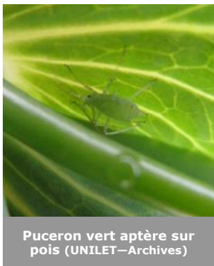
Puceron vert aptère sur pois