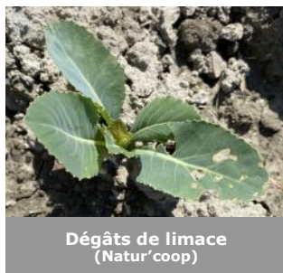
Dégâts de limace (Natur'coop)

La présence des papillons de noctuelle ( Autographa gamma ) et de teigne ( Plutella xylostella ) en parcelle est encore très faible. Les conditions des jours à venir ne leurs seront pas favorables.