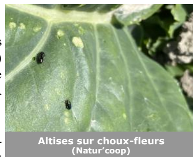
Altises sur choux-fleurs (Natur'coop)

Les altises des crucifères arrivent progressivement sur les cultures de choux. Des individus sont signalés dans une parcelle de choux-fleurs à Saint-Omer (62) (infestation faible pour le moment : présence sur moins de 5% des choux et pas de dégât constaté). A Sercus (59), les altises sont présentes sur 32% des brocolis. A Haubourdin (59), de très nombreux individus sont présents sur radis.