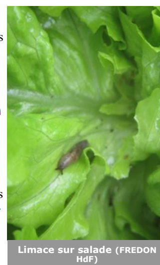
Limace sur salade (FREDON HdF)

Pour plus d'informations sur ce ravageur, n'hésitez pas à consulter ce lien .