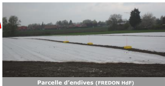
Parcelle d'endives

Les bacs jaunes posés à Haisnes (62) dans le but de surveiller la présence de la mouche de l'endive, du puceron lanigère et de la mouche prédatrice de ce dernier ( Thaumatomyia spp. ) n'ont capturés qu'une Thaumatomyia .