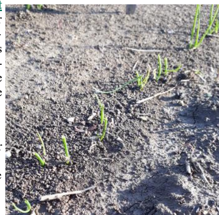
Dégâts de gibier sur oignon (PLRN)