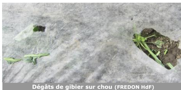
Dégâts de gibier sur chou

A Ennetières-en-Weppes (59), des attaques de gibier sont signalées sur les quelques choux non-voilés et dès qu'il y a des trous dans le voile. A Sercus (59), 12% des brocolis ont subi des attaques de gibier. A Saint-Omer (62), des dégâts de gibier à plume sont de nouveau signalés : les feuilles sont parfois arrachées jusqu'à la nervure.