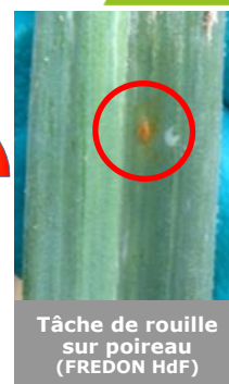
Tâche de rouille sur poireau (FREDON HdF)