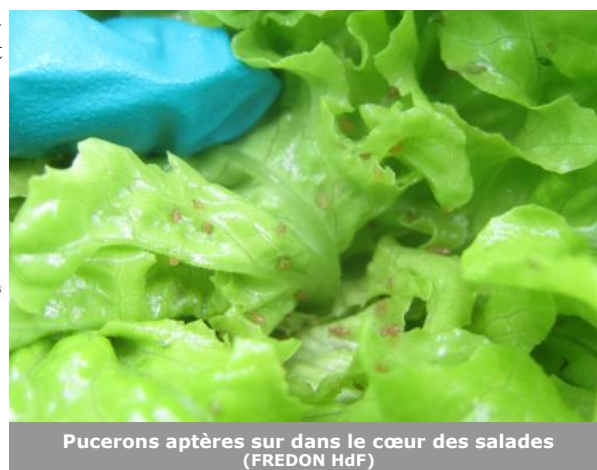
Pucerons aptères sur dans le cœur des salades (FREDON HdF)