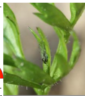
Puceron ailé sur carotte

La présence de pucerons ailés est signalée dans une parcelle en Baie de Somme. Hors réseau, pas de signalement. La remontée des températures annoncées sera favorable à leur développement.