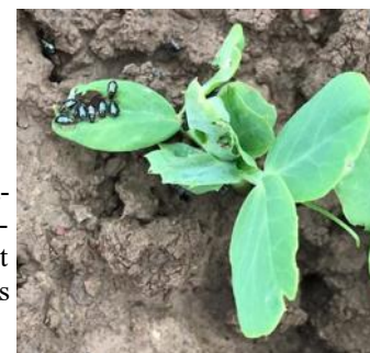
Altises sur pois (Ets Cousin)