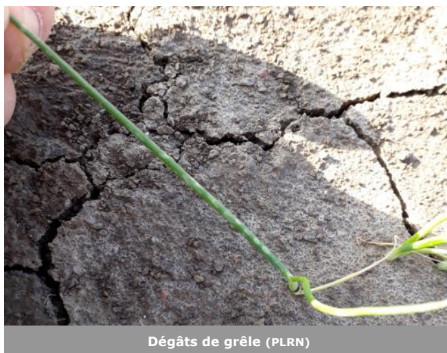
Dégâts de grêle (PLRN)

La situation est saine dans les parcelles d'oignons au stade fouet à Richebourg (62) et au stade première feuille à Lorgies (62).