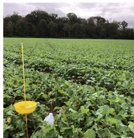
Cuvette jaune à hauteur de végétation

Des macules de phoma sont observés dans 2 parcelles. La résistance variétale est le seul moyen de lutte sur cette maladie.