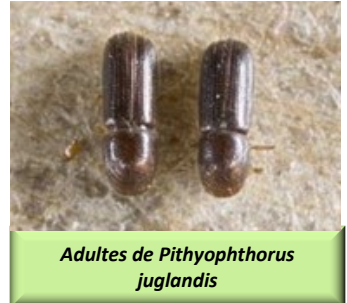
Adultes de Pityophthorus juglandis