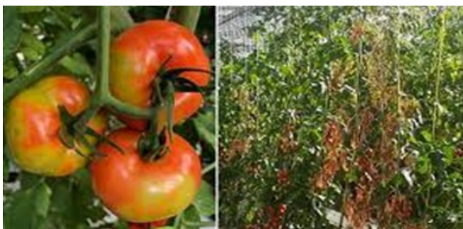
Dégâts de ToBRFV