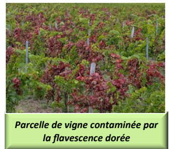
Parcelle de vigne contaminée par la flavescence dorée

Action pilotée par le ministère chargé de l'agriculture et le ministère chargé de l'écologie, avec l'appui financier de l'Office Français de la Biodiversité, par les crédits issus de la redevance pour pollutions diffuses attribués au financement du plan Ecophyto.