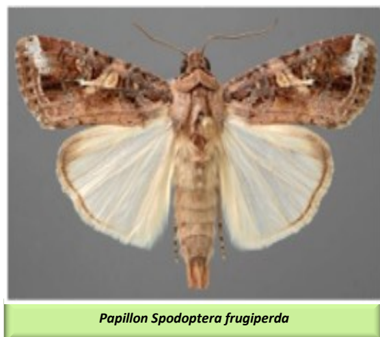
Papillon Spodoptera frugiperda