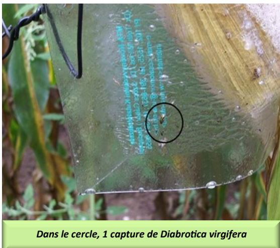
Dans le cercle, 1 capture de Diabrotica virgifera