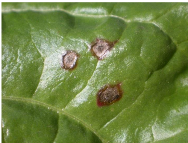
Présence de fructifications