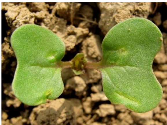
Morsures d'altises sur cotylédons

Le risque est faible cette semaine. En revanche, les températures chaudes annoncées pour la fin de semaine seront favorables au vol des altises. Il faut donc rester vigilant et continuer les observations.