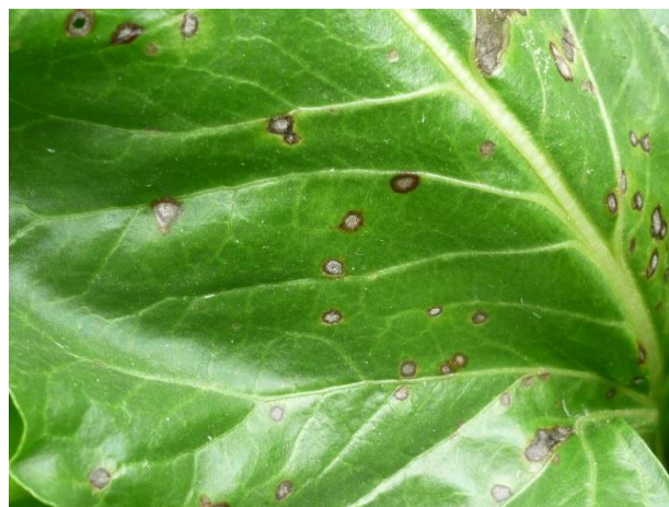
Taches de cercosporiose