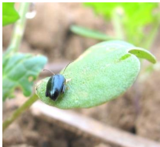
Grosses altises en cuvette et sur plante

Seuil de nuisibilité altises adultes : 80 % de pieds avec morsures et ¼ de la surface foliaire détruite de la levée au stade 3 feuilles.