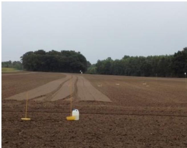
Mise en place dispositif observation BSV- M. Roux-Duparque (CA 02)