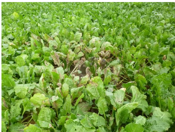
Foyer de cercosporiose