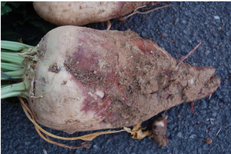
Rhizoctone violet