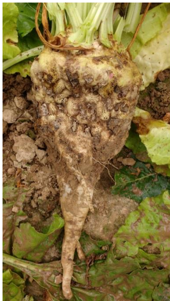
Symptôme d'aphanomyces sur racine