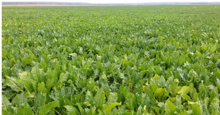
Parcelle touchée par l'Aphanomycés

mais aussi des parasites comme les nématodes.