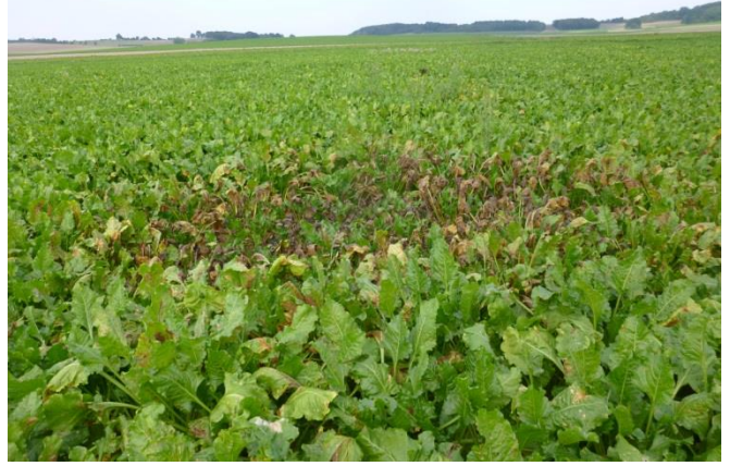
Foyer de cercosporiose

Actuellement 61 % des sites observés sont maintenant concernés par le T2.