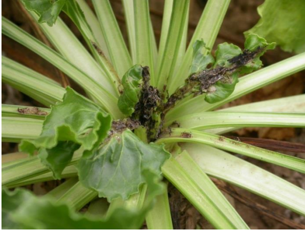
dégât de teigne au cœur du feuillage de betteraves

De plus ces teignes arrivent tardivement sur une végétation plus développée qu'en 2015 et les fortes chaleurs sont maintenant passées.