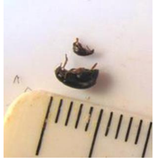
Grosse et petite altise C. Gazet –CA59/62 (archives)