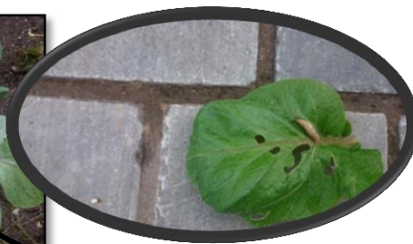
Dégâts de limaces