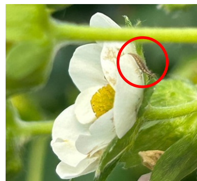
Larve de chrysope (C BLANCKAERT CA59/62 )

Dès l'apparition de quelques individus, des auxiliaires peuvent être introduits sous abris (parasitoïdes, larves de syrphes, larves de chrysopes).