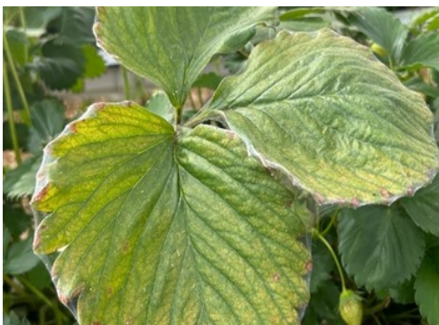
Dégâts d'acariens tétranyques : formation de toiles

Dans les parcelles où de premiers acariens ont été observés, mais aussi en prévention, il est possible d'introduire des auxiliaires prédateurs sous abris.