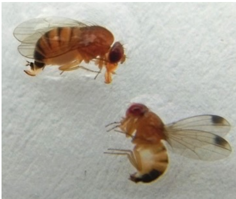
Drosophiles mâle et femelle (C BLANCKAERT CA59/62)

Une récolte tous les deux jours est le meilleur moyen de limiter les dégâts.