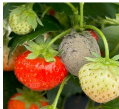
Botrytis sur fruit

Concernant les plants trop fortement touchés par le botrytis de cœur, leur élimination permettra de limiter la prolifération de la maladie. Il en est de même avec les fruits touchés, il faut les éliminer pour éviter qu'ils ne contaminent leurs voisins.