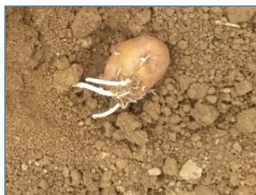
Variété Lady claire , plantée mi avril