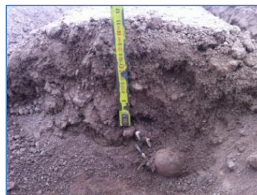
Variété Destiny, plantée le 18 avril