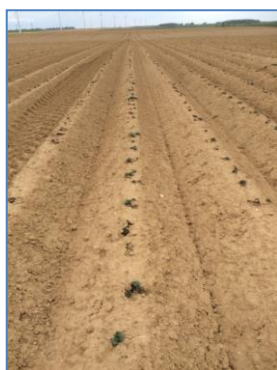
Sinora, plantée le 20 mars (source Gitep)