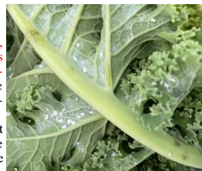
Aleurodes sur chou kale (Natur'Coop)

Les aleurodes se cachent parfois sur la face inférieure des feuilles. Ce sont surtout les dégâts indirects qui sont préjudiciables pour la culture : la fumagine (maladie provoquée par des moisissures noires dues à des champignons) se développe grâce au miellat sécrété par les insectes piqueurs-suceurs.