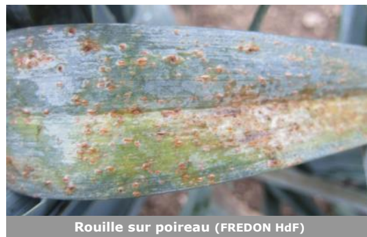
Rouille sur poireau