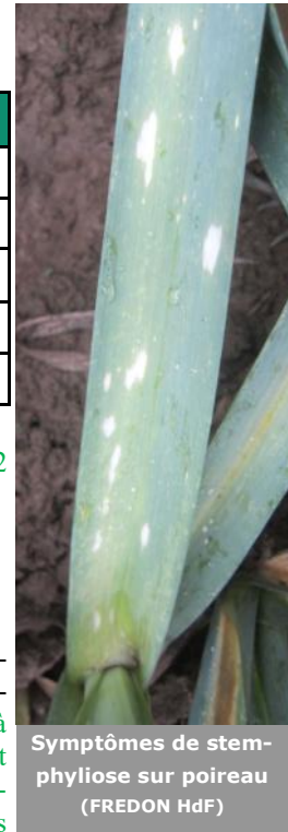
Symptômes de stemphyliose sur poireau (FREDON HdF)