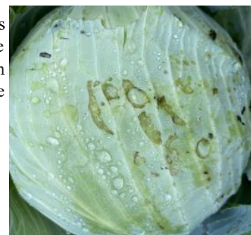
Dégâts de limaces sur chou (Natur'Coop)

Des limaces et leurs dégâts sont observés sur des choux en bordure de parcelle dans le secteur Audomarois (62). Leurs morsures peuvent toucher plusieurs couches de feuilles. Avec les températures plus douces, elles attaquent les choux aussi bien en journée que la nuit. Les limaces se cachent au pied du chou. Elle continue de se nourrir sur les choux stockés en hangar. Restez vigilants !