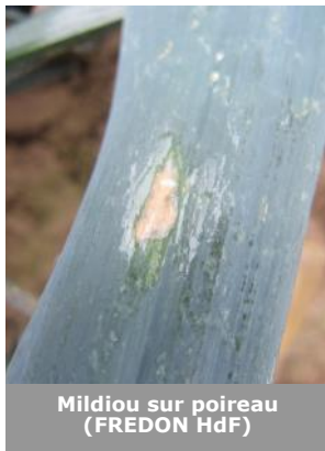
Mildiou sur poireau (FREDON HdF)