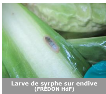
Larve de syrphé sur endive

A Loos-en-Gohelle (62), des auxiliaires (larves de syrphes) sont observés.