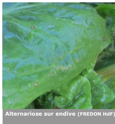
Alternariose sur endive (FREDON HdF)

Sur l'endive, la rouille se caractérise par des taches marrons de 1 mm sur le feuillage, qui évolueront en pustules noires.