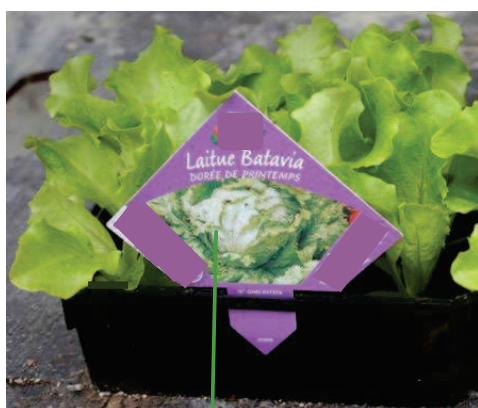
PP imprimé au dos

Exemples non exhaustifs d'apposition de Passeport Phytosanitaire :