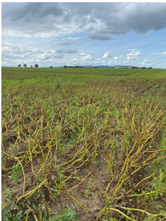
Zone de parcelle détruite par le mildiou (62)