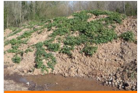
Écoulement de jus sur un tas non géré

N'épandez pas les déchets sur les parcelles cultivées et jachères après le mois de février car la destruction des tubercules par le gel est plus difficile.