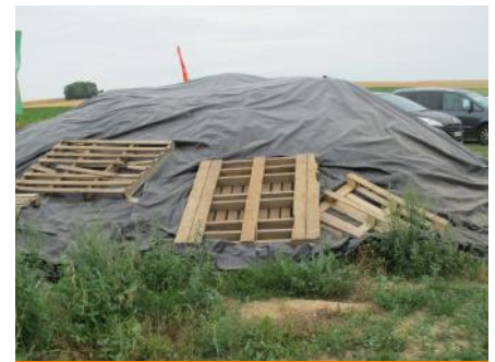
Tas de déchets bâché (photo d'archive)