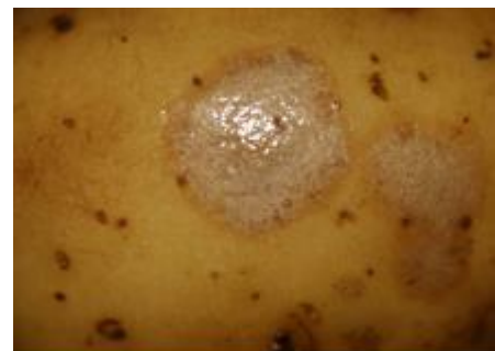
Gale argentée sur tubercule