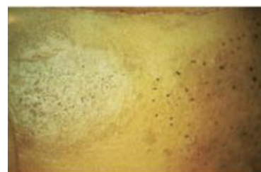
Gale argentée Dartoise