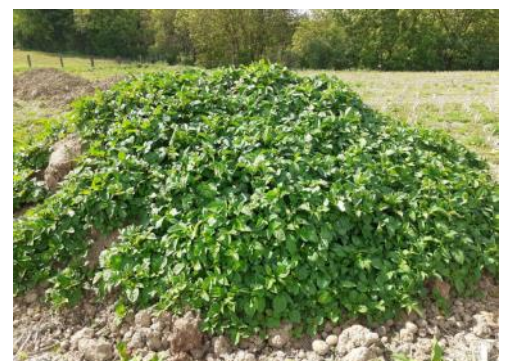
Repousses sur un tas constitué de déchets et d'écartés de triage (photo d'archive)