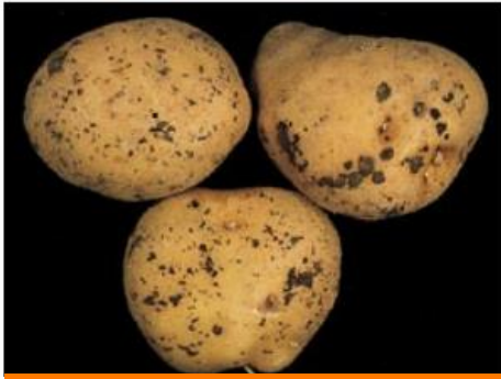
Sclérotés sur tubercules