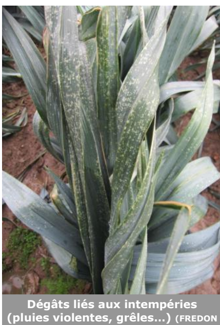
Dégâts liés aux intempéries (pluies violentes, grêles...) (FREDON)