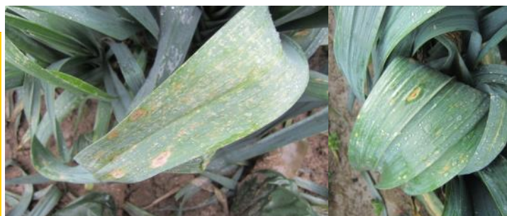
L'intensité des dégâts liés à la rouille dépend de plusieurs facteurs (FREDON NPDC)