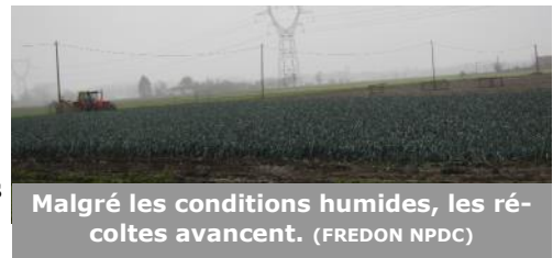
Malgré les conditions humides, les récoltes avancent.

Les températures annoncées pour les prochains jours sont comprises entre -2 et 6°C. Quelques pluies éparpillées sont aussi annoncées.