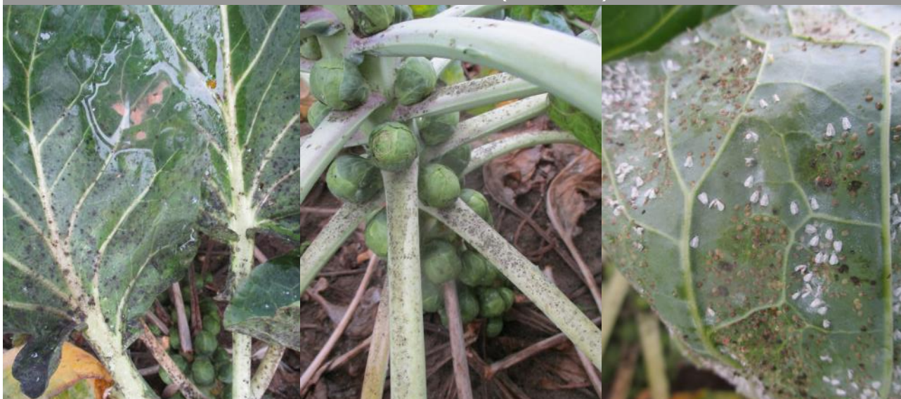
Fumagine et aleurodes sur choux de Bruxelles (FREDON HdF)

Si vous avez des choux frisés et/ ou des choux de Bruxelles, que vous ayez ou non des aleurodes, n'hésitez pas à contacter Laetitia Durlin ( laetitia.durlin@fredon-hdf.fr ) pour participer à une étude sur l'impact que les pratiques culturales et l'environnement peuvent avoir sur la pression des aleurodes. Le nombre de réponses à cette étude pourra peut-être nous aider à comprendre pourquoi certaines parcelles sont très touchées et d'autres pas du tout. Ces résultats seront pris en compte pour mettre en place des mesures préventives ou des méthodes de lutte.