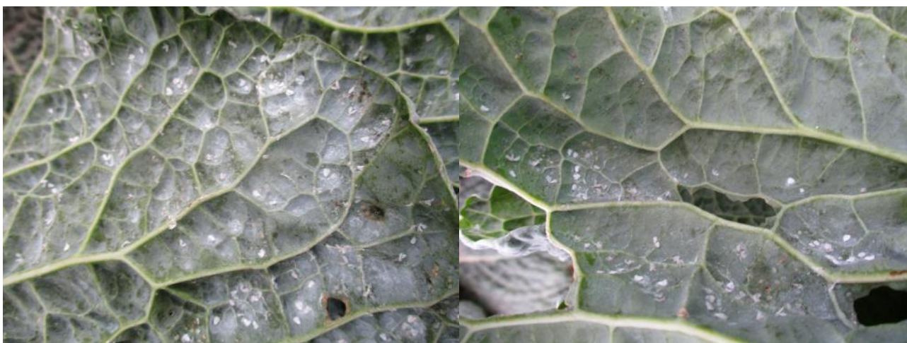
Aleurodes sur choux frisés

Sur certaines parcelles, les aleurodes sont toujours bien présents. Actuellement, les populations sont bien installées mais ne se développent plus car les températures sont trop faibles.