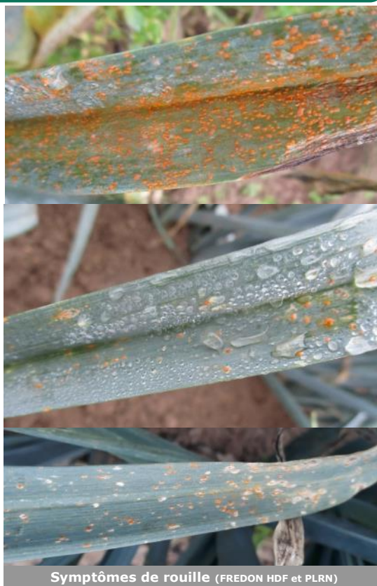
Symptômes de rouille (FREDON HDF et PLRN)