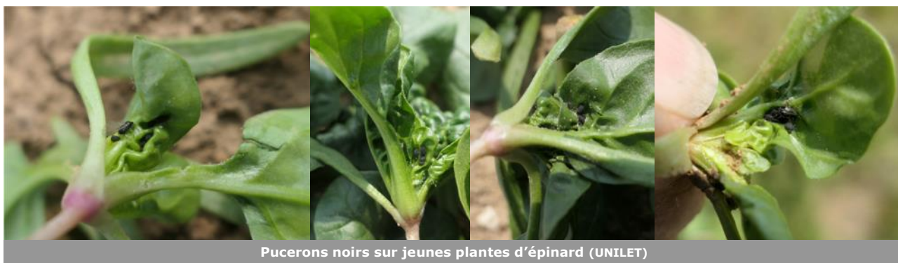
Pucerons noirs sur jeunes plantes d'épinard (UNILET)

Les pucerons sont toujours présents en plaine ( 5 parcelles sur 6 avec des colonies de pucerons). Seule la parcelle la plus tardive encore au stade 2 feuilles échappe au problème. Le taux de plantes avec colonies de pucerons est variable : de 8% à Arvillers (80) à 76% à Athies (80) Le seuil indicatif de risque est de 50% des plantes avec colonies.