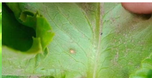
Puceron parasité