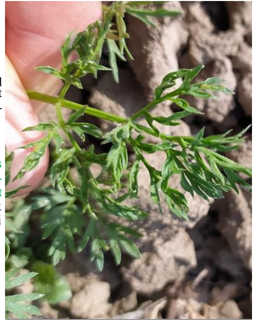
Pucerons aptères de Cavariella aegopodi sur folioles de carotte (UNILET)

Les pucerons sont toujours très présents sur les carottes tout comme les insectes auxiliaires et notamment les larves de coccinelles. Les conditions climatiques restent toujours favorables aux pucerons et il convient de rester vigilant. Le seuil indicatif de risque est d'une plante sur deux colonisée, surtout si on observe les premières colonies d'aptères ce qui est très souvent le cas actuellement.