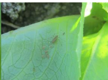
Pucerons aptères et puceron ailé (FREDON HdF)