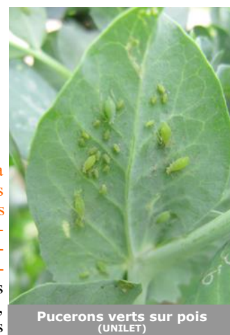
Pucerons verts sur pois (UNILET)

Les pucerons verts continuent d'être observés dans une parcelle sur deux. Comme la semaine dernière, aucune forte infestation n'est signalée, et la proportion de plantes avec 3 à 10 pucerons est souvent faible (cas dans les trois parcelles les plus « infestées »). Par contre, le temps caniculaire du week end semble avoir favorisé l'explosion des populations sur un certain nombre de parcelles hors réseau, où, en l'absence de protection, les seuils indicatifs de risque ont été dépassés. A noter que les insectes auxiliaires sont déjà bien présents dans les parcelles. D'autre part, on ne note pas encore la présence de plantes virosées dans les parcelles pour le moment. Pour rappel, le seuil indicatif de risque est de 5 pucerons par extrémité de tige avant floraison puis de 10 par extrémité de tige au moment de la floraison.