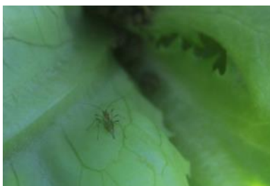
Puceron ailé (FREDON HdF)