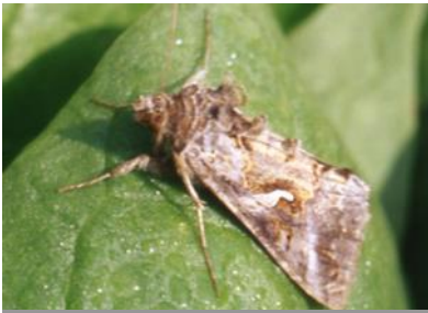
Noctuelle gamma sur épinards (UNILET)