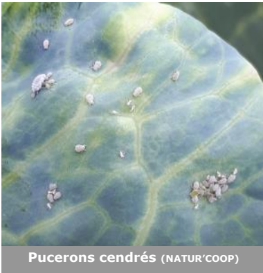
Pucerons cendrés (NATUR'COOP)