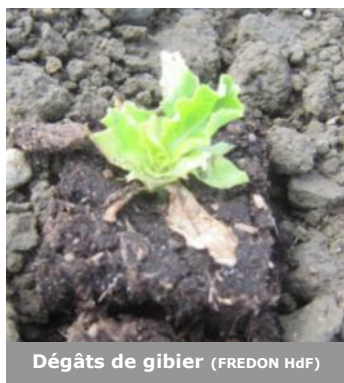
Dégâts de gibier (FREDON HdF)