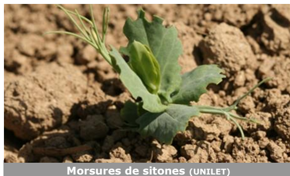
Morsures de sitones (UNILET)

Les morsures de sitones restent bien visibles dans 6 des 7 parcelles fixes suivies cette semaine, avec des dégâts plus ou moins importants selon les parcelles. Les populations de sitones sont en baisse . Pour rappel, les sitones doivent être surveillés jusqu'au stade six feuilles de pois. Si les morsures occasionnées sont parfois assez spectaculaires, la destruction des plantules est rare. Leur nuisibilité provient de leurs larves qui détruisent les nodosités et les racines, perturbant ainsi l'alimentation azotée des plantes, et réduisant le rendement.