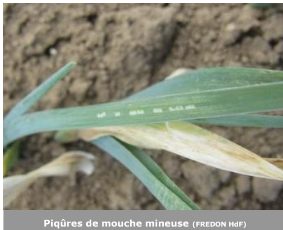
Piqûres de mouche mineuse (FREDON HdF)

A Violaines (62), sur les plaques bleues seuls deux thrips ont été piégés. Aucun thrips n'a été observé sur la culture, la pression est très faible pour le moment et des pluies sont annoncées dans les prochains jours.