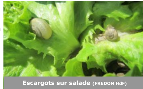
Escargots sur salade

A Calonne-sur-la-Lys (62), des escargots sont observés sur des salades en bord de fossé. Quelques dégâts sont aussi présents sur les feuilles de la base.