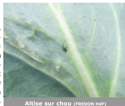
Altise sur chou

A Ennetières-en-Weppes (59), une altise a été observée sur 30% des choux. A Zuytpeene (59), 3 altises sont présentes sur 12% des pieds. La pression est faible pour le moment, les pluies et les températures encore un peu fraîches ne vont pas être favorables au développement de ces insectes. Le premier vol a lieu généralement en mai avec l'arrivée des premières températures plus chaudes. Actuellement, elles ne sont pas nombreuses. Un binage de la parcelle peut suffire à réduire la population. Il semble intéressant aussi d'irriguer la culture après la plantation pour accélérer la croissance et/ou couvrir la culture avec un filet (maille < 0,8 mm). Si la taille des mailles est supérieure 0,8 mm, les altises mangent les feuilles à travers le filet.