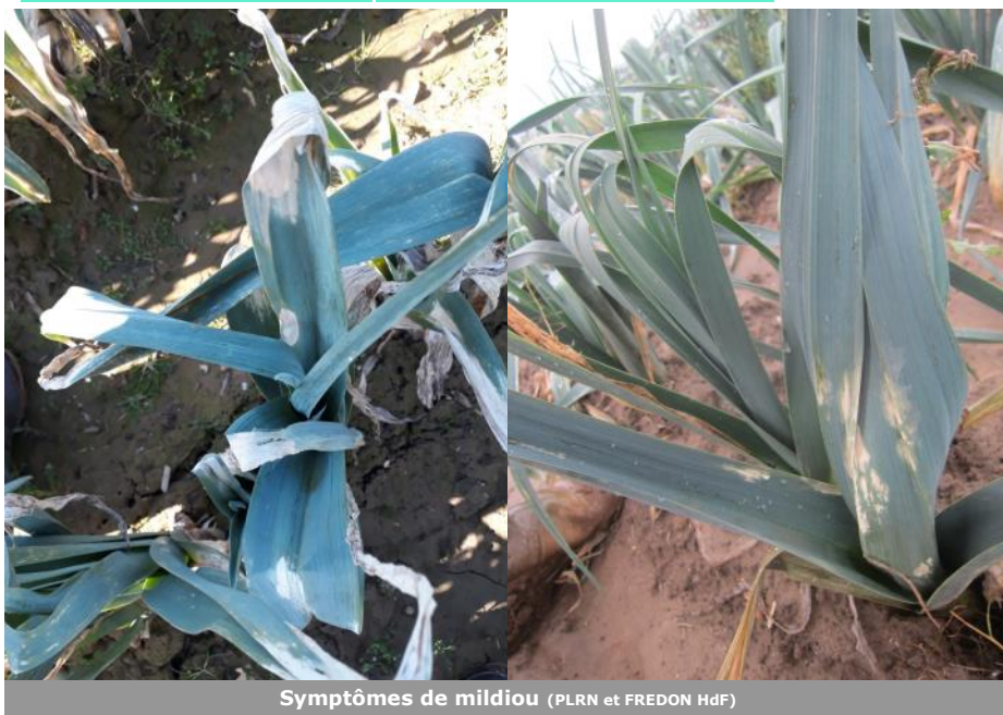
Symptômes de mildiou (PLRN et FREDON Hdf)