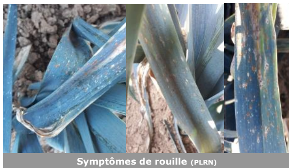
Symptômes de rouille (PLRN)

Sur le réseau, toutes les parcelles sont touchées par la maladie. De manière générale, la rouille se développe de nouveau sur certaines parcelles, on voit qu'elle est bien sporulante. Les conditions optimales pour l'infestation sont une température de 15°C avec 100% d'humidité pendant 4 heures. Seul un temps froid avec des températures inférieures à 5°C bloque la maladie. Les températures annoncées pour les prochains jours, comprises entre 8 et 14°C, seront favorables au développement de la maladie. Restez vigilants, en particulier sur les variétés dites « sensibles ».