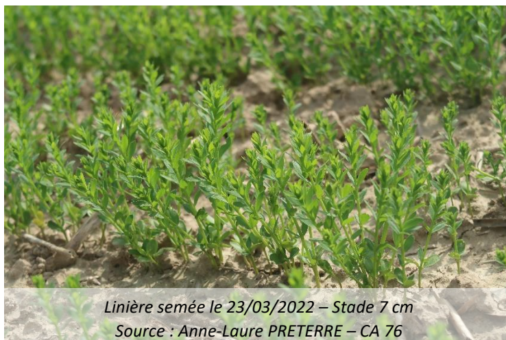
Linière semée le 23/03/2022 – Stade 7 cm