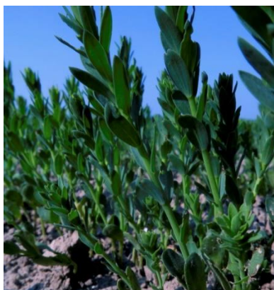
Linière au stade 7 cm