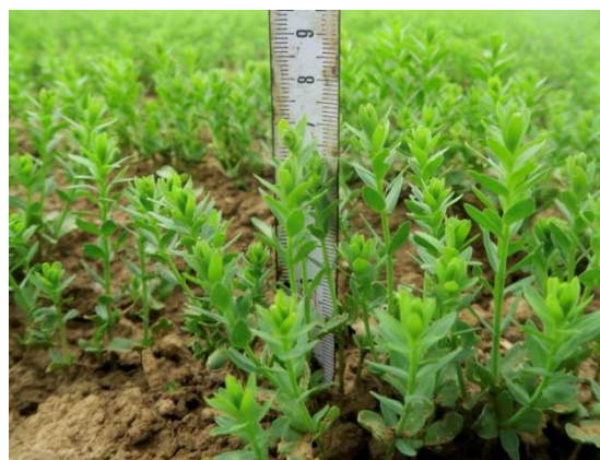
Photo : Claude GAZET – CA 59-62 : Parcelle de lin à 7 cm à Sebourg (59)

Les linières du réseau sont majoritairement entre les stades 5 et 10 cm. Les moins avancées sont au stade 3 cm.