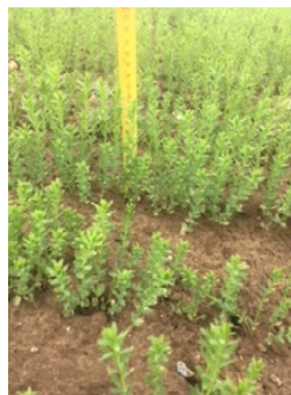
Photo : Hervé GEORGES – CA 80 : Parcelle de lin à 8 cm dans la Somme (80)