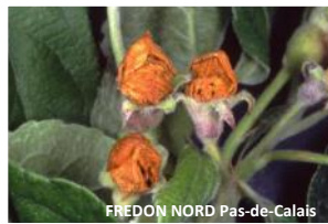
Dégât d'anthonome du pommier sur boutons floraux

Les larves poursuivront alors leur développement au sein des boutons aux dépens des organes de la fleur.