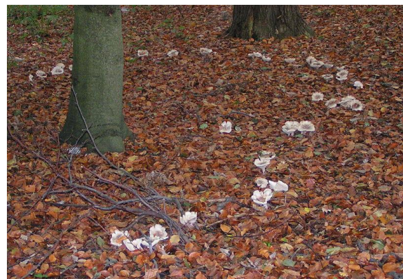
De gauche à droite : Rond de sorcière ; Faux rond de sorcière (le mycélium du champignon suit la progression des radicelles du hêtre)