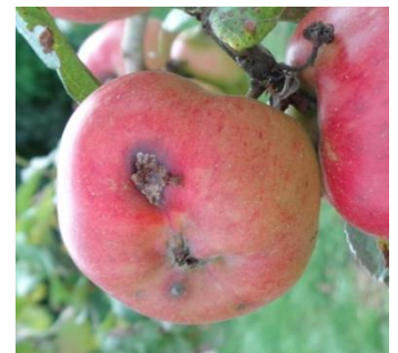
Dégâts de carpocapse sur pomme

Vous pouvez aussi recourir au piégeage grâce à des bandes de carton ondulé attachées autour du tronc en fin d'été/ début d'automne : au début de l'hiver, retirez les bandes et écrasez chenilles et cocons (ne pas les brûler car des auxiliaires s'y abritent également) puis les remettre en place.