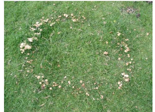
Rond de sorcière

En effet, c'est le mycélium souterrain du champignon qui enrichit le sol en nitrates et qui provoque localement une pousse différente de l'herbe . Celle-ci est généralement plus verte dans le rond qu'à l'extérieur de celui-ci. Les « ronds de sorcières » grandissent chaque année en suivant l'expansion du mycélium.