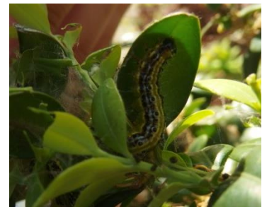
Chenille de pyrale du buis

Si les buis sont de petite taille et les attaques restreintes, il est possible d'envisager une lutte physique en coupant les parties de la plante infestées et en enlevant manuellement les œufs, les chenilles vertes et noires et les chrysalides de la pyrale du buis. Si vous possédez des haies de buis ou des buis de grande taille, vous pouvez secouer ou frapper vos buis avec un bâton. Les chenilles étant sensibles aux vibrations, elles tomberont au sol. Pour faciliter le ramassage, disposez au préalable un filet ou un tissu au pied de vos buis. Vous pourrez ensuite ébouillanter ou brûler les chenilles.