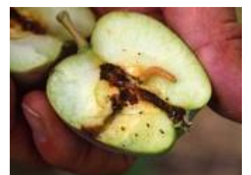
Larve de carpocapse

Pour plus d'informations : http://www.nord-pas-de-calais.chambre-agriculture.fr/fileadmin/user_upload/Hauts-de-France/028_Inst-Nord-Pas-de-Calais/Telechargements/Phytosanitaire/bsv-arboriculture-fruitiere/BSV-arboriculture-fruitiere-58.pdf