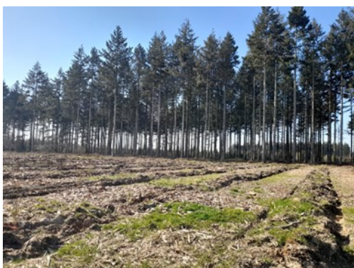
Plantation en plein ayant bénéficié de travaux préparatoires du sol

Suite aux événements climatiques exceptionnels de cette année, une augmentation des mortalités de plants a été observée. Les difficultés de reprise sont très liées aux conditions rencontrées durant la première année de végétation après plantation.