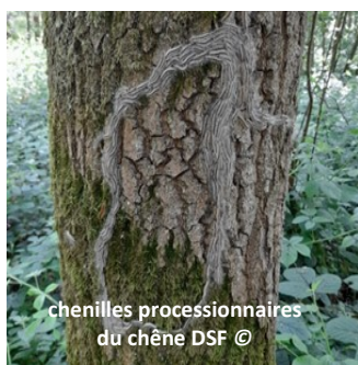
chenilles processionnaires du chêne

Ces deux espèces sont bien distinctes et même très différentes tant dans leur biologie que leur impact sur les forêts. Alors que les stades larvaires de la première n'attaquent que les chênes durant l'été, les chenilles de la seconde consomment les aiguilles de pins durant l'hiver. Seul leur caractère grégaire et urticant les réunit.