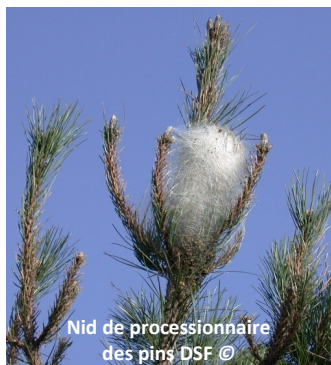
Nid de processionnaire des pins DSF ©