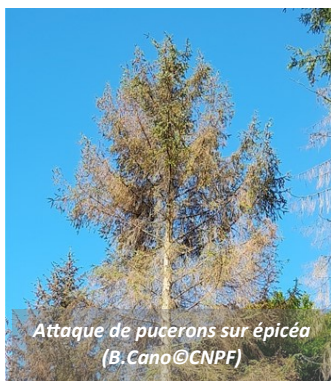
Attaque de pucerons sur épicéa

La processionnaire du pin, comme sa cousine du chêne, engendre des phénomènes de gradation temporaires, mais ne provoque en revanche que rarement des dégâts sur les arbres. L'enjeu de santé publique en raison de son caractère urticant, reste le même.