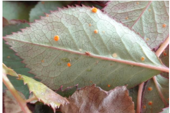
Symptôme de rouille sur feuille de rosier

Cette maladie a été présente sur l'ensemble des sites d'observations avec l'apparition des premiers symptômes à partir de la mi-avril puis avec un pic début juin . Les conditions climatiques ont été particulièrement favorables à cette période pour le développement de la maladie.