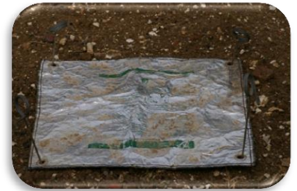
Dispositifs de piégeage du pot Barber et de la nappe à gastéropodes