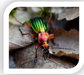
4 familles d'auxiliaires suivies dans le cadre du réseau « Potager » en JEVI (de gauche à droite) : coccinelle, chrysope, syrphe et carabe

Le réseau « Potager » est composé de 5 sites fixes (1 dans l'Oise et 4 dans la Somme).