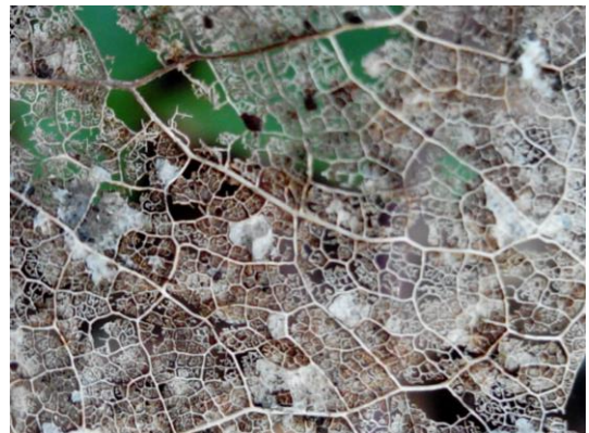
Vue du ciel, feuille en dentelles fragiles– 1 er prix