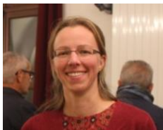
Lauréate du concours photo - prix jury